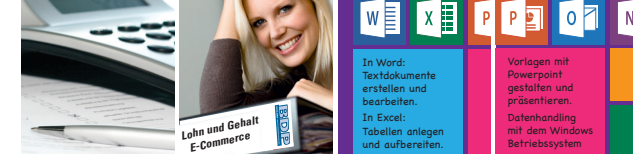
Kaufmännische Weiterbildung mit Zertifikatsabschlüssen & Praxisphase